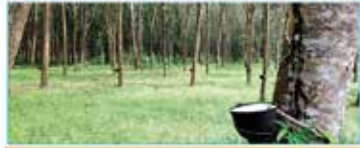
Programme social du gouvernement (PS-Gouv)

Des conventions signées, hier, avec 12 sociétés de la filière hévéa